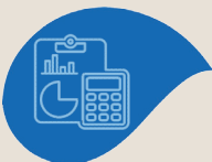
Module 7 Comptabilité – Finance