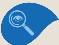
Module 8 Audit – Inspection