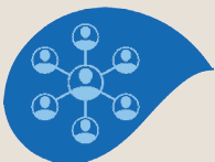
Module 3 Ressources Humaines