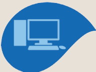
Module 6 Informatique – Numérisation