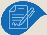
Module 2 Administration