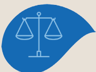
Module 4 Juridique