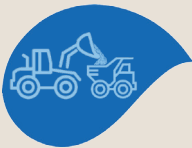
Module 5 Exploitation