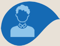
Module 1 Direction Générale

Cette formation est structurée autour de 8 modules avec un module introductif.